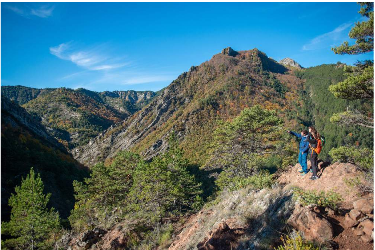
Sur le sentier qui monte vers le Vieil Esclangon

* Nous pouvons être amenés à modifier l'itinéraire indiqué : soit au niveau de l'organisation (problème de surcharge des hébergements, modification de l'état du terrain, éboulements, sentiers dégradés, etc.), soit directement du fait du guide (météo, niveau du groupe, etc.). Ces modifications sont toujours faites dans votre intérêt, pour votre sécurité et pour un meilleur confort.