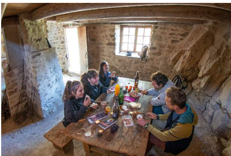
En haut : dans le refuge d'art du col de l'Escuichière. En bas à gauche : déjeuner dans le refuge d'art du Vieil Esclangon. En bas à droite : le palindrome de herman de vries.