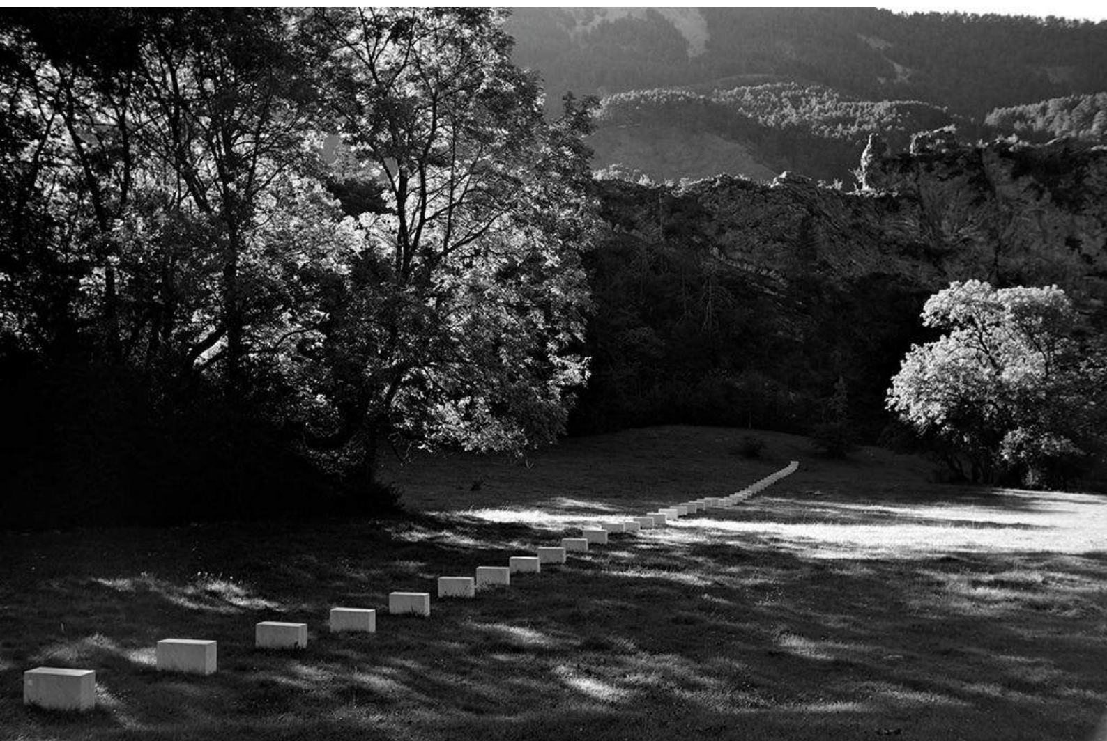
Vièze et les moyennes montagnes

GROUPES PRIVÉS : TOUTE L'ANNÉE AUX DATES DE VOTRE CHOIX