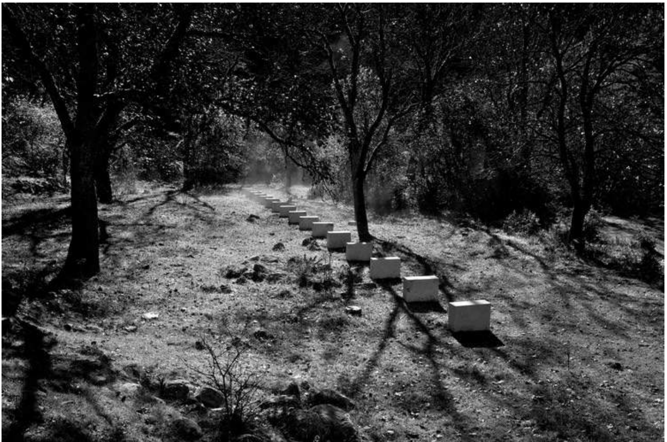
Vière et les moyennes montagnes ©Richard Nonas