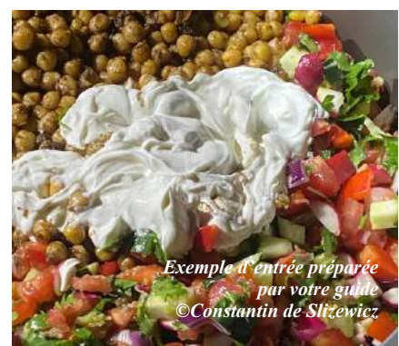
Exemple d'entrée préparée par votre guide