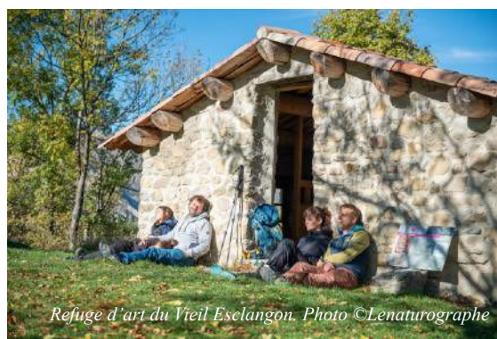
Refuge d'art du Vieil Esclangon.