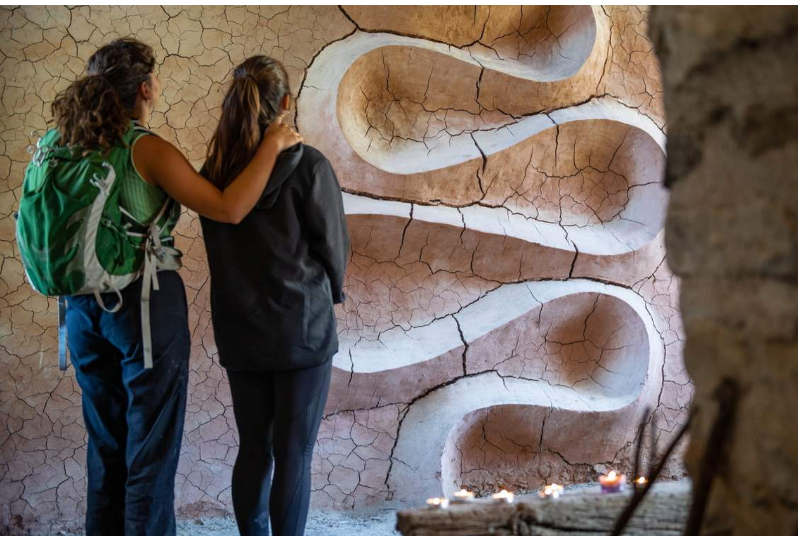
Dans le refuge d'art du Vieil Esclangon

2024 : 8-9 JUIN / 31 AOUT-1 ER SEPTEMBRE / 16-17 NOVEMBRE GROUPES PRIVÉS : AUX DATES DE VOTRE CHOIX ENTRE LE 01/04 ET LE 31/11