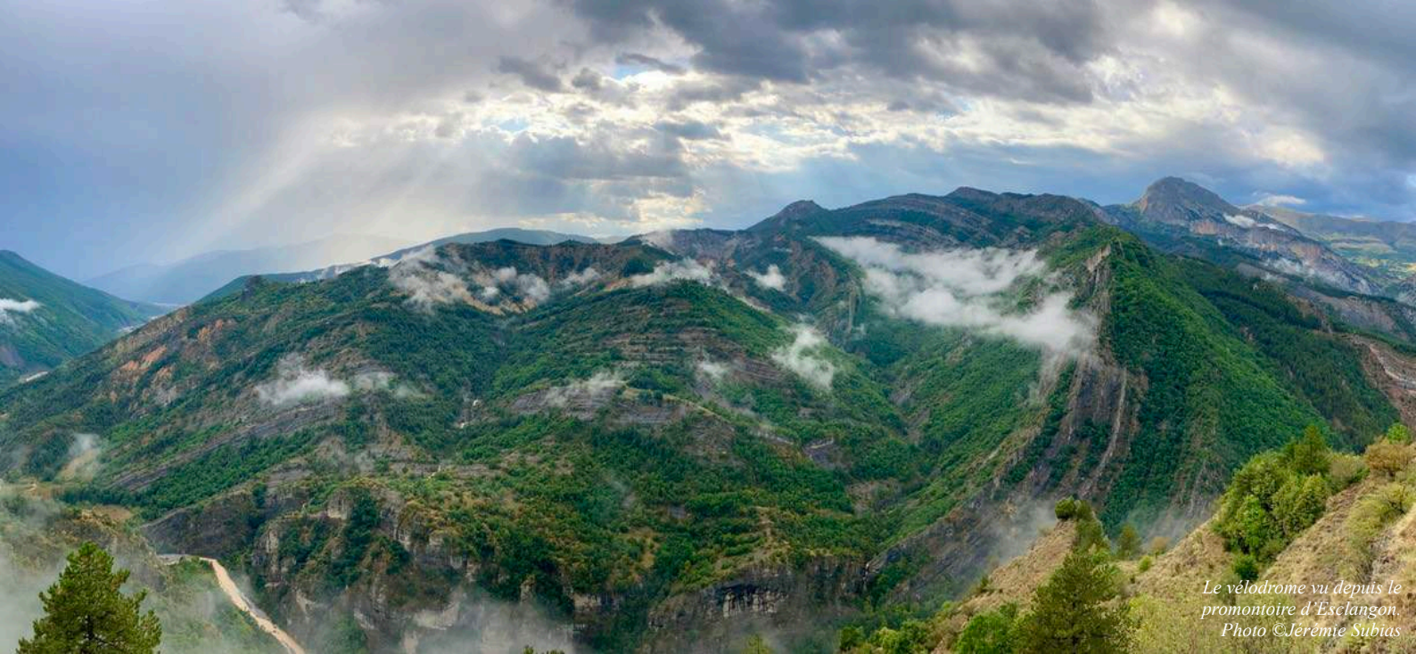
Le vélodrome vu depuis le promontoire d'Esclangon.