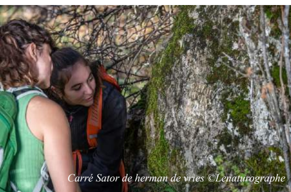
Carré Sator de herman de vries