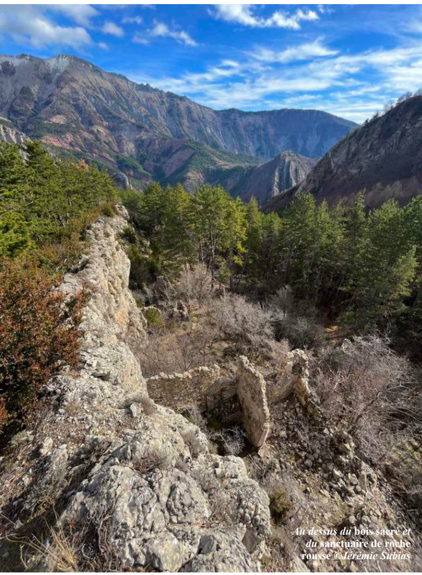
Au dessus du bois sacré et du sanctuaire de roche rousse